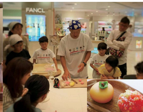
乃し梅本舗佐藤屋で和菓子づくり体験(イメージ)

■主催：「山寺と紅花」推進協議会 ■企画・実施：株式会社山形アドビューロ・株式会社アイサイト・山形E旅 ■協力：宝珠山立石寺・やまがたまると館「紅の蔵」・山寺ガイドきざはし会・山形舞子紅の会・乃し梅本舗佐藤屋・ふもとや本店