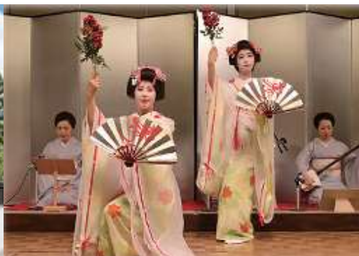
やまがた舞子のお座敷遊び初級講座(イメージ)