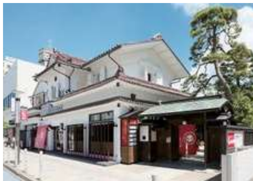
やまがたまると館「紅の蔵」日本遺産構成文化財

不滅の法灯は比叡山延暦寺の開山以来1200年以上に渡り途絶えることなく守り継がれてきた。860年に延暦寺より山寺に分灯され、織田信長により比叡山が焼き討ちに際し、その灯火を分けて比叡山の不滅の法灯は復活したという。