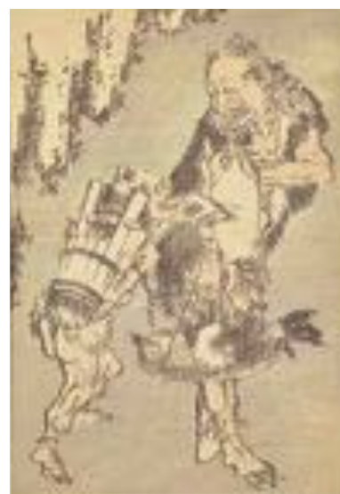
《北斎漫画十編 鬼の買い物》1819年(文政2)