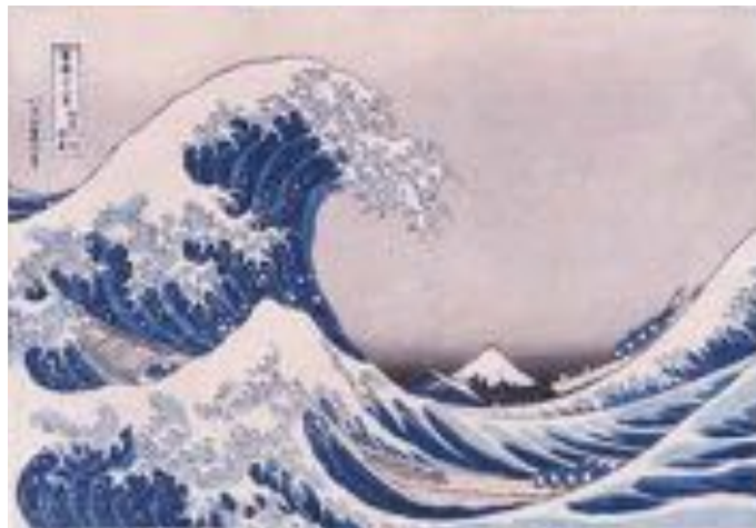
《富嶽三十六景 神奈川沖浪裏》1831年(天保2)頃