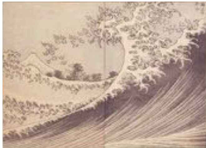
《富嶽百景 海上の不二》1835年(天保6)

世界に名高い江戸時代後期の絵師・葛飾北斎(1760~1849)。約70年にわたる画業のなかで、卓越した画技をつくして森羅万象を描き、海外でも高い評価を受けています。なかでも絵手本として発行し、風景、動植物、人物、風俗、妖怪などを描いた『北斎漫画』(1814-1878年)、そして日本を代表する山、「富士」を描いた『富嶽三十六景』(1831年頃)と『富嶽百景』(1836年以降)は北斎版画作品の代表作として知られています。この展覧会では1980年代半ば以降、山形美術館に寄託されたコレクションより、『富嶽三十六景』と『富嶽百景』は全てを、『北斎漫画』は一部抜粋した作品を一挙展示いたします。日本が世界に誇る北斎の版画芸術の世界をご堪能ください。