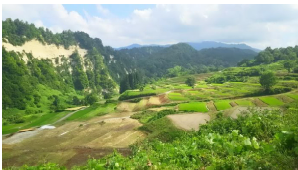
作品名:「真夏の棚田」(8月撮影)